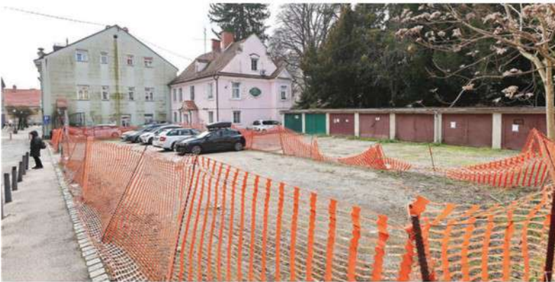
Za zemljišča ob Gospejni 13 je SH Global plačal 353.800 evrov.