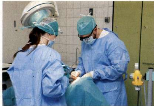
Zdravstvena reforma deluje. Še enkrat: deluje. (Na fotografiji oddelek za maksilofacialno kirurgijo na UKC Ljubljana)

Kakovostno, močno in dobro javno zobozdravstvo je le eno. Takšno, ki temelji na preventivi in je osredotočeno na otroke. Na Danskem je javno zobozdravstvo že od leta 1972 trdno vpeto v šolski sistem, zato je udeležba pri pregledih in drugih posegih skoraj stoodstotna. Tudi Slovenija je v osemdesetih in devetdesetih letih imela takšen sistem, a smo ga dejansko razgradili. Za otroke danes v preventivnih programih skrbi le še 300 zobozdravnikov (timov). Zato ima pri nas več kot polovica otrok do šestega leta karies. In ko takšni otroci odrastejo, so veliko bolj odvisni od komercialnih zobozdravstvenih storitev – v katere so se slovenski zobozdravniki v vmesnem času preusmerili. Implantati so seveda veliko dobičkonosnejši kot deljenje fluorovih tablet in učenje ščetkanja zob. x