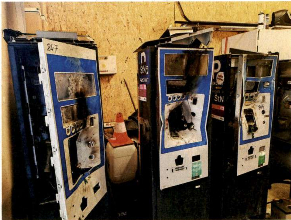
Uničeni parkomati, ki so nekoč stali v Štepanjskem naselju.