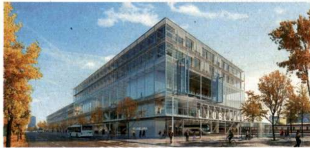
Nova avtobusna postaja v Ljubljani naj bi bila nared že prihodnje leto. /Foto: ilustracija: Bevk Perovič arhitekti

V slovenski zakonodaji je tudi še kar nekaj različnih določil, ki spodbujajo uporabo avtomobilov, eno izmed njih je sistem povračila stroškov prevoza na delo oziroma tako imenovanih potnih stroškov. Trenutni sistem, ki upošteva število prevoženih kilometrov, deluje kot finančna spodbuda za uporabo avtomobila, potni stroški pa se dojemajo kot neoddavčen dodatek k plači. x