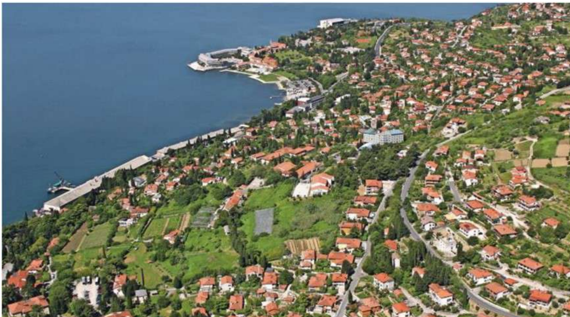
Dve gradbeni dovoljenji sta bili izdani v neverjetno kratkem času. Ta sreča doleti le izbrance. Zemljišče Ob Belokriški cesti je zelenica skrajno desno na fotografiji.