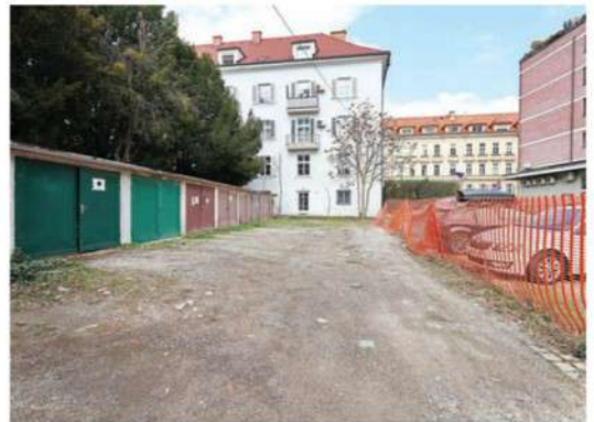
V dražbenem razglasu je pisalo, da se kupec z nakupom parcele, po kateri je dostop do garaž, zaveže ustanoviti neodplačno služnost dostopa do garaž.