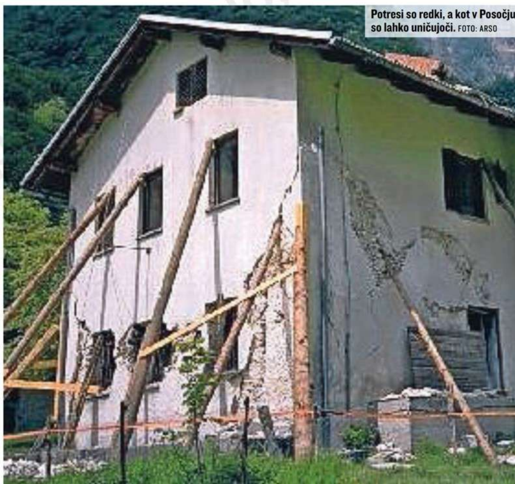
Potresi so redki, a kot v Posočju so lahko uničujoči.