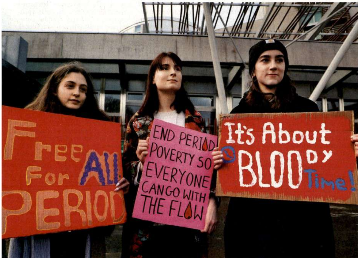
Škotska je leta 2021 prva na svetu uvedla dostop do brezplačnih higienskih izdelkov za ženske.