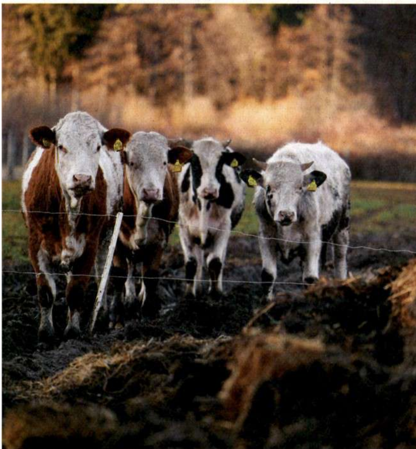
V Sloveniji smo lani redili približno 455.680 govedi. V primerjavi z desetletjem prej ga redimo manj, bistveno več pa perutnine.

Tudi pri nas so bili lani, kot leta prej, prejemniki največ kmetijskih subvencij veliki sistemi, zlasti proizvajalci mesa in mesnih izdelkov.