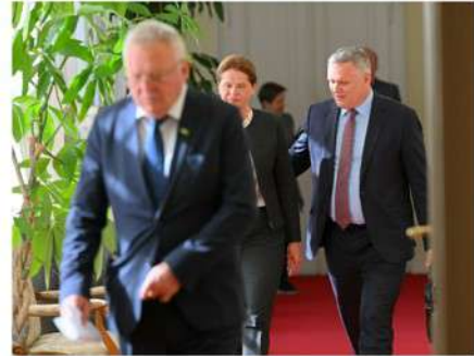
Del ministrske ekipe ob prihodu na sejo.

Po besedah Bojana Kumra zadostne zaloge plina pomenijo tako zanesljivost oskrbe kot tudi večjo varnost za gospodinjstva, javne ustanove in gospodarstvo med največjo porabo, ko so razmere na trgih lahko tudi najbolj nepredvidljive. "Pravočasno polnjenje skladišč tako pomeni manjšo izpostavljenost cenovnim šokom ter večjo stabilnost in predvidljivost oskrbe z zemeljskim plinom," je dejal minister.