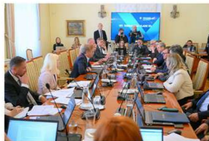
S petkovo ustanovno sejo državnega zbora bo zdajšnji vladni ekipi prenehal mandat.

Redna seja vlade je bila sicer zadnja, ki jo je s polnimi pooblastili vodil premier Robert Golob . Ministrica za kulturo in sokoordinatorica Levice Asta Vrečko je v izjavi pred začetkom seje mandat ocenila kot relativno uspešen in dejala, da bi se gotovo lahko marsikaj naredilo tudi drugače in boljše. Predvsem obžaluje, da ni bila izpeljana davčna reforma. "Sem pa absolutno ponosna na naša tri ministrstva Levice, ker smo se lotili projektov, ki so stali več kot 20, 30 let," je dejala. Ob tem je navedla novi sistem dolgotrajne oskrbe, stanovanjsko gradnjo , pokojninsko reformo in ukrepe na področju kulture. "To so stvari, ki morajo ostati za dobro ljudi in družbe," je dejala. Postorijo lahko še marsikaj, če bodo za to imeli priložnost v prihodnji vladi, je dodala.