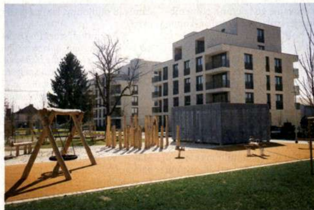
Stanovanjski program smo zagnali. A Slovenija zmore veliko več. Vsaj petkrat več. (Na fotografiji nova soseska neprofitnih najemnih stanovanj Zelena jama v Ljubljani)

Toda tak razvoj ni pravičen. Slovenija je danes evropska davčna oaza za nepremičninske magnate. V zahodnoevropskih državah nepremičninski in premoženjski davki k BDP prispevajo od dveh odstotkov (Danska, Italija) do 3,7 odstotka (Francija, Belgija), v Sloveniji le približno 0,5 odstotka. Če bralec pri tem upošteva še, da pri nas nimamo drugih mehanizmov za preprečevanje špekulativnih nakupov stanovanj – na Dunaju ni mogoče ustvarjati dobička s preprodajo zazidljivih zemljišč, dobiček nepremičninskih podjetij je omejen, najemnine so regulirane –, mora biti očitno, da postaja to ena največjih resničnih slovenskih težav: Uvedba nepremičninskega davka in uvedba premoženjskega davka sicer ne bi smela biti namenjena poljnemu proračunski malhe, ampak regulaciji socialnih, stanovanjskih in urbanističnih politik, a tudi z vidika proračuna je ta uvedba smiselna. Saj nas že svetilniki kapitalistične ureditve, kot je organizacija OECD, opozarjajo, da imamo pri nas kapital – beri nepremičnine – premalo obdavčen. x