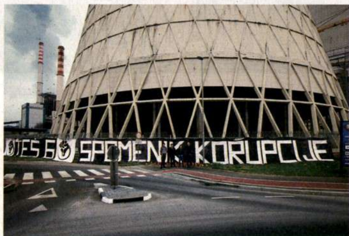
Politiki imajo polna usta boja proti korupciji, toda ali so se zmožni odpovedati svojim toplim vrtičkom? (Na fotografiji spomenik korupciji pred TEŠ 6 v Šoštanju leta 2013)

Zgled takšnega sistema je lahko Nemčija. Tam je enotna točka namesto strankarskih skladov državna razvojna banka KfW – njena sestrška institucija v Sloveniji se imenuje SID banka. KfW deluje preprosto: podjetja ne morejo zaprositi za sredstva neposredno, vloge sprejema zunanja partnerska banka, ki najprej preveri finančno stanje podjetja in investicijski predlog. Projekti morajo torej skozi finančno sito, ne skozi postopek, ki ga opravi politična administracija. KfW nato ugodna posojila zagotavlja prek komercialnih bank, ki prevzamejo del tveganja. In še dodaten učinek: KfW na isti način pomaga Nemcem korenito nižati stroške stanovanjskih posojil. V Sloveniji za zdaj SID banka tako subvencionira nakupe poslovnih nepremičnin. Prek nje lahko podjetja dobijo ugodna, večdesetletna posojila za nakup poslovnih nepremičnin z 0,7-odstotno (plus euribor) obrestno mero. Jamstvena posojila, namenjena mladim, za zdaj še ne delujejo, ker, kot so sporočili iz SID banke, komercialne banke za sodelovanje v tej shemi ne kažejo zanimanja ... x